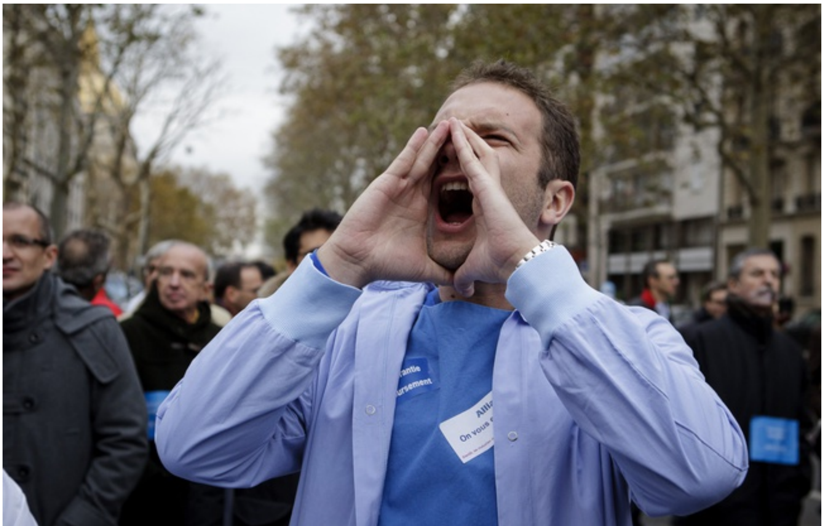
Paris le 12 novembre 2012. Manifestation des étudiants en médecine dénonçant leurs mauvaises conditions de travail.